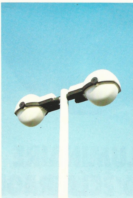
▲ 2 Mandoline sur candélabre STRIAL