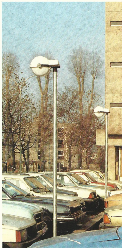
Mandoline sur candélabre TR 32 ▶