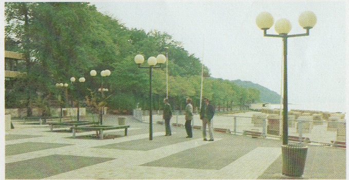
Luminaire boule M 3405