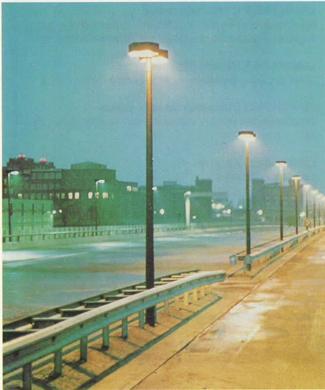
Luminaire double M 3572 Pour banquettes centrales