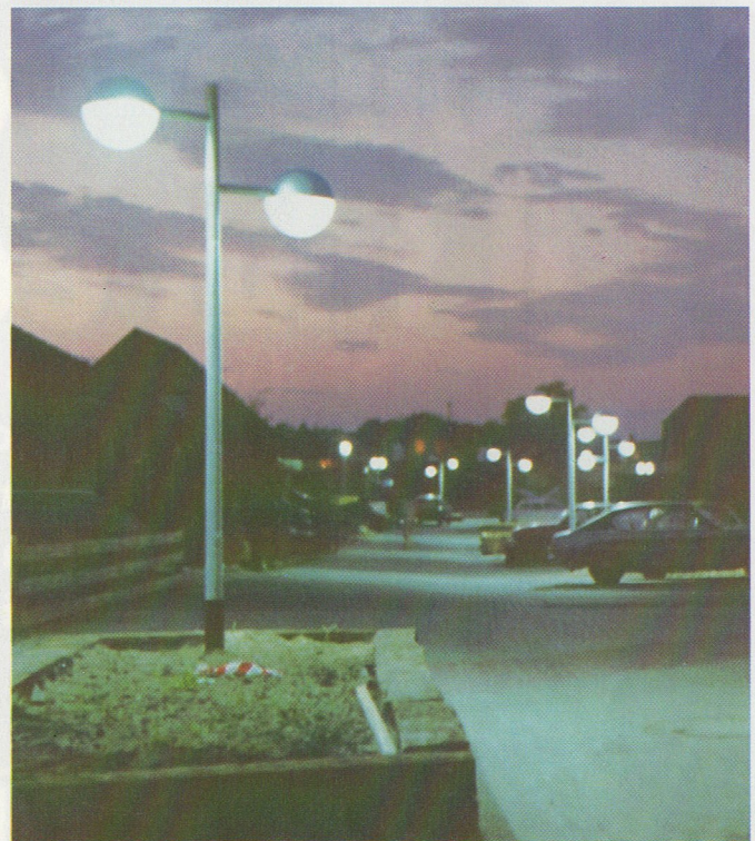
Luminaire boule M 3401