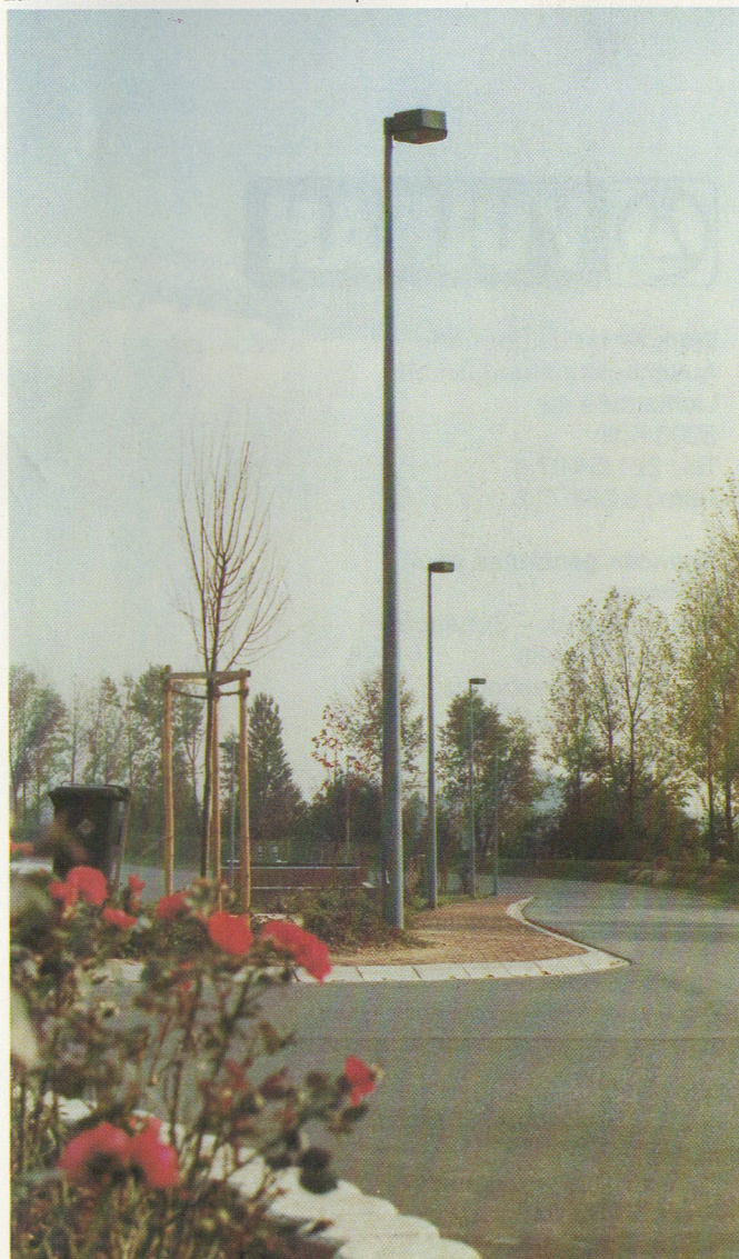
Luminaire M 3570