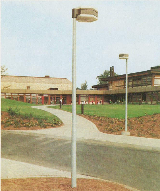
Luminaire M 3543