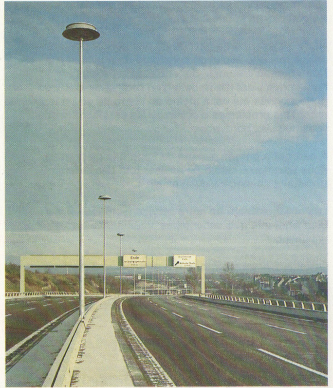
Luminaire G 2800 Type Grandes Surfaces