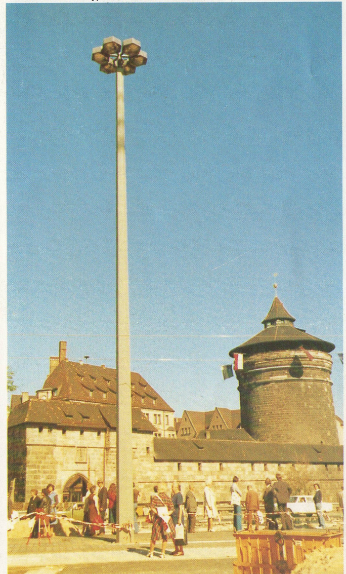
Groupe de 6 luminaires M 3582