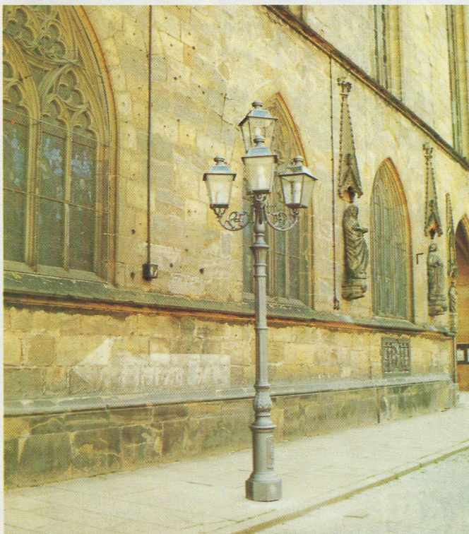
Luminaire style M 7429